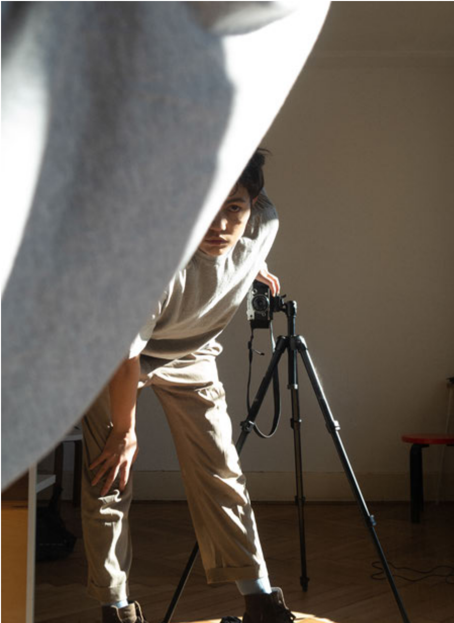
Karla Hiraldo Voleau, A Man in Public Space , 2020.

SG : En général, un-e photographe émergent-e utilise des ressources et moyens contemporains pour traiter de problématiques actuelles, pour aborder des sujets d'actualité. C'est dans ce sens-là que j'entends le terme d'émergence : un regard nouveau sur une problématique sociétale contemporaine.