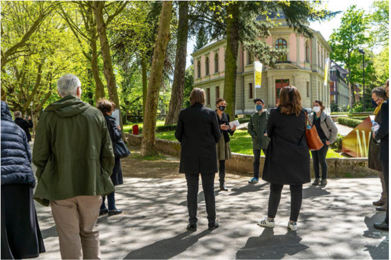
Vvisite guidée de la 24 ème édition des Journées photographiques de Bienne / Bieler Fototage, Cracks, 7.5.–30.5.2021