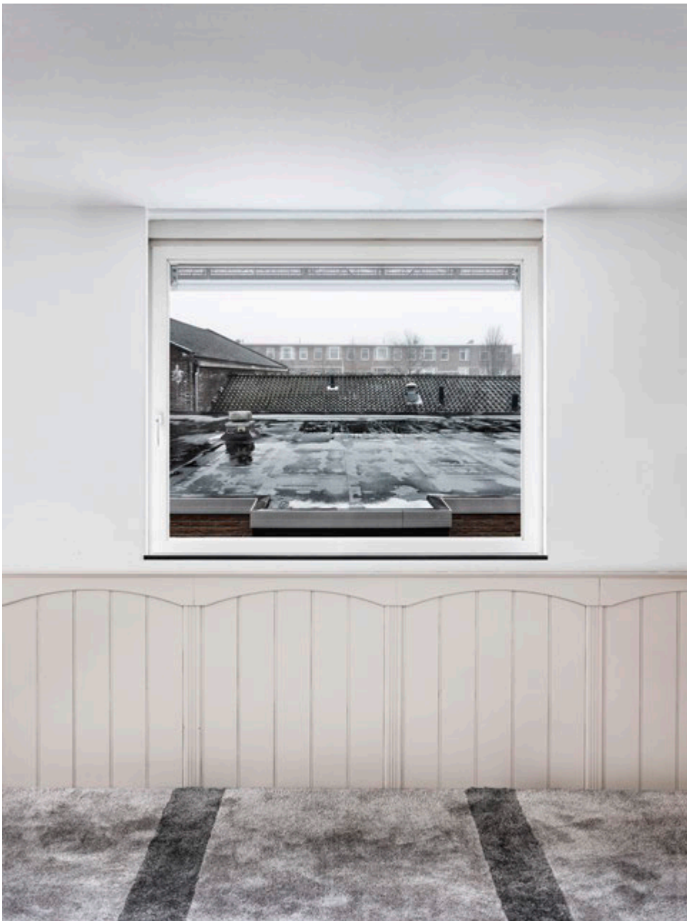
Marwan Bassiouni, New Dutch Views , The Netherlands, 2018.

ND : Quels aspects du poste de directrice du festival t'intéressaient le plus au moment où tu as postulé ?